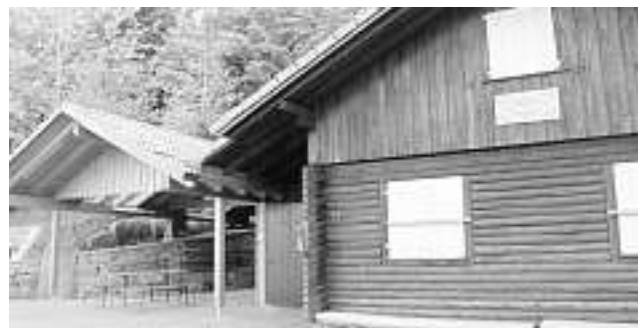
Die Rolläden auf der Otmarhütte beim Schwarzwaldverein Schapbach bleiben bis Ende Juni zu.

Der Schwarzwaldverein Schapbach hat eine neue Homepage. Sie lautet: www.schwarzwaldverein-schapbach.de