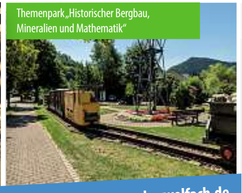
Themenpark „Historischer Bergbau, Mineralien und Mathematik“