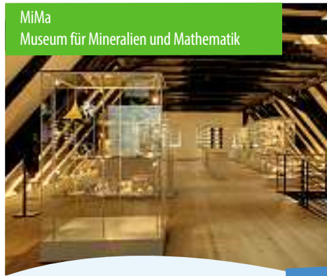
MiMa Museum für Mineralien und Mathematik