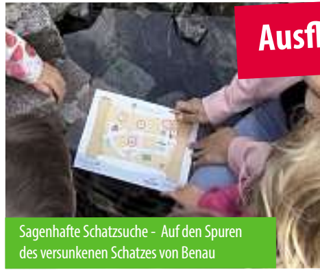
Sagenhafte Schatzsuche - Auf den Spuren des versunkenen Schatzes von Benau