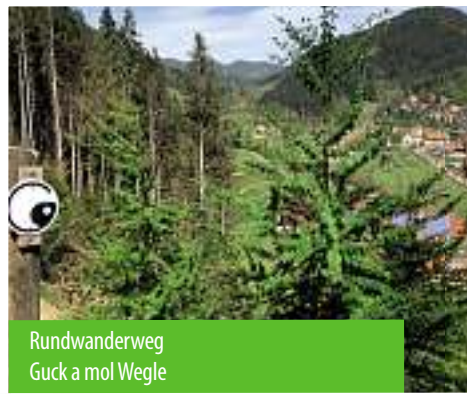
Rundwanderweg Guck a mol Wegle