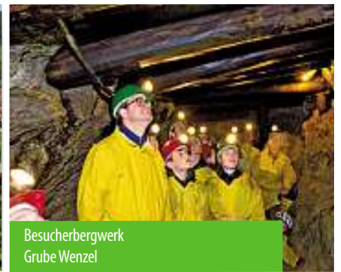
Besucherbergwerk Grube Wenzel