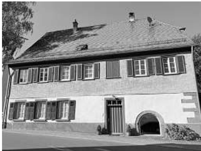
Die LEADER-Aktionsgruppe Nordschwarzwald unterstützt den Erhalt des Pfarrhauses in Altensteig-Spielberg.

Vor diesem Hintergrund sind auch die Internetplattform HOLZPLANWERK und das Handbuch zum Erhalt der regionalen HOLZBAUKULTUR NORDSCHWARZWALD entstanden, ebenfalls LEADER-Projekte. Da das Handbuch mit einer Auflage von 2.500 Stück bereits vergriffen ist, wird, laut Müller, jetzt nachgedruckt. Online kann das Handbuch unter www.holzplanwerk.de angeschaut und heruntergeladen werden.