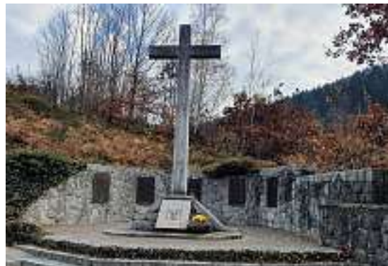
Bernhard Waidele Bürgermeister