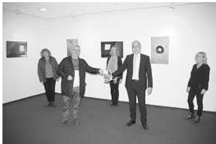
Bei der corona-bedingt kurzen und mit stark reduzierter Zahl an Anwesenden stattgefundenen Jahrbuch-Präsentation von links:

Die Vielfalt der Natur in unserer Region ist ein weiterer Schwerpunkt im neuen Jahrbuch: 24 heimische Singvögel unserer Region und seltene Kleinschnecken, Wasserschnecken und Muscheln aus dem Isenburger Tal präsentieren sich in wunderbaren Fotos und beschreibenden Texten; zwei Autoren stellen uns ihre Lieblingsplätze – das Loßburger Zauberland und das Glatttal – vor, und die Eichenäcker-Schule in Dornstetten hat sich in einem altersübergreifenden Projekt mit besonderen Wegen und Plätzen im Landkreis künstlerisch auseinandergesetzt. Es freut die Jahrbuchredaktion ganz besonders, mit welchem Eifer sich die Schülerinnen und Schüler an dem jährlichen Schulprojekt des Jahrbuchs beteiligt haben.