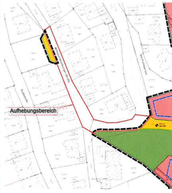
Abbildung 4: 1. Änderung (Teilaufhebung) des Bebauungsplanes