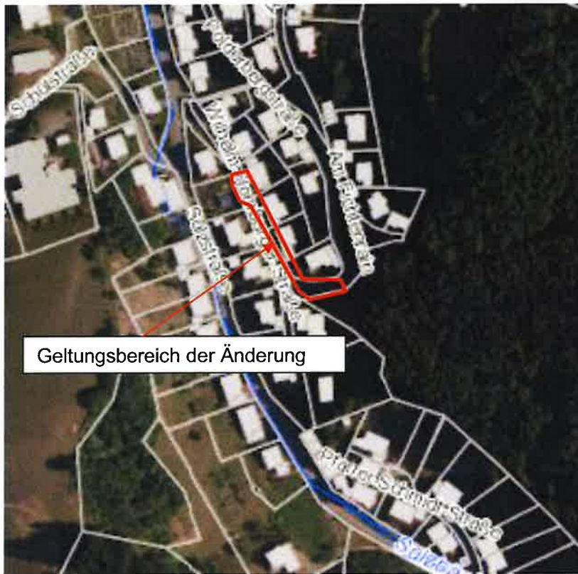
Abbildung 2: Luftbild mit Eintragung des Plangebiets; Quelle: LGL BW, eigene Darstellung

Der Änderungsbereich befindet sich in der Wilhelm-Homburger-Straße und erstreckt sich im Bereich des Flurstücks Nr. 30/9 (Spielplatz Wilhelm-Homburger-Straße) bis zum vorgesehenen Zufahrtbereich in das Baugebiet „Wohnen mit Wolftalpanoramablick am Polderberg“.